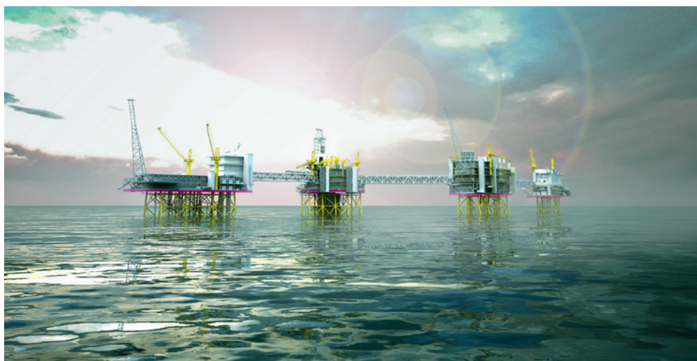
Johan Sverdrup. Illustrasjon / Statoil